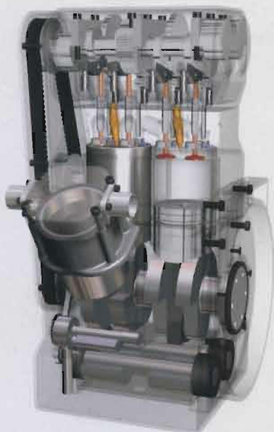
Der finnische „Z-Motor“ soll die Vorteile von Vier- und Zweitaktern verbinden.

Die erste Stufe besteht aus einem Turbolader, der ohne Wastegate-Verluste stets die komplette Abgasenergie nutzen kann, die zweite aus einem Kolben-Verdichter, der in den Motor integriert ist. Durch den niedrigen Arbeitsdruck des Verdichters (rund zehn Prozent des Drucks des Arbeitszylinders) kann er verhältnismäßig leicht und kostengünstig ausgeführt werden, die Temperatur der komprimierten Luft bleibt ebenfalls vergleichsweise niedrig. Durch den auf bis zu 15 bar erhöhten