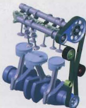
Im Ilmor-Fünftakter verrichten die Abgase im mittleren Zylinder nochmals Arbeit.

auf zwei Zylinder verteilt – einer zum Ansaugen und Verdichten, der zweite für Verbrennung und Ausstoß. Beide sind durch eine Hochdruckleitung miteinander verbunden, die die vorverdichtete Luft ventilgesteuert an den Arbeitszylinder weitergibt. Für die Nutzfahrzeugwelt ist hierbei vor allem das an dieser Stelle als Puffer vorgesehene Druckluft-Reservoir interessant – ein zusätzlicher Kompressor könnte auf diese Weise entfallen.