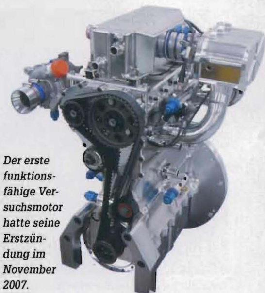
Der erste funktionsfähige Versuchsmotor hatte seine Erstzündung im November 2007.