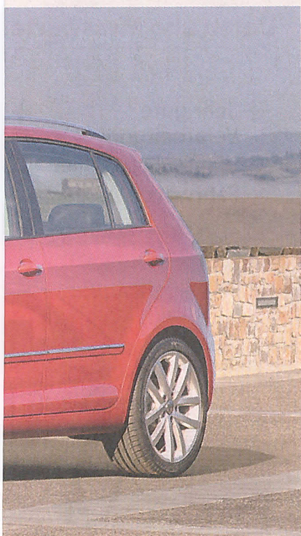
sforderungen des Alltags.